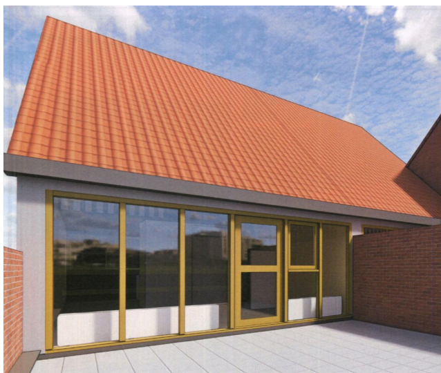
1 oorspronkelijke staat

De eerste 3 foto's werden als optie door Welbions aangeleverd. Optie 4 hebben wij zelf ingebracht.