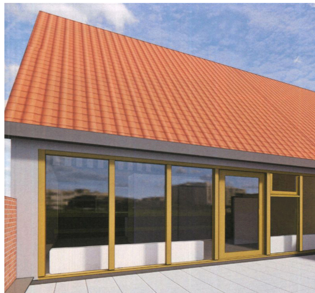
4 eigen ontwerp